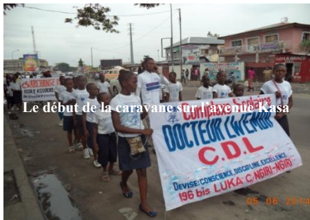
Le début de la caravane sur l'avenue Kasa

Du 07 au 09 mai 2014, la Coalition Nationale de l'Education Pour Tous en RDC a organisé les activités de la Semaine Mondiale d'Action 2014 en collaboration avec l'UNESCO, Action aid, OSISA, ANCEFA, la Campagne Mondiale pour l'Education Pour Tous ainsi que la Maison de la Laïcité de Kinshasa.