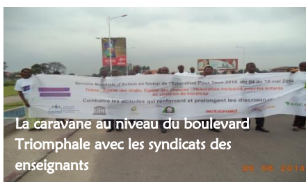
La caravane au niveau du boulevard Triomphale avec les syndicats des enseignants

L'itinéraire emprunté par la caravane a été le Boulevard Triomphal, l'avenue de 24 novembre pour chuter à l'Académie des Beaux Arts à 11h40 minutes.